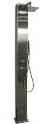
DUSCHE TRINIDAD SOLAR